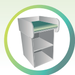
Plans de change